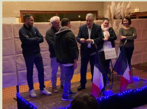
Vœux du Conseil