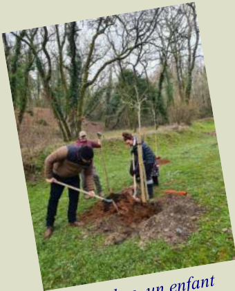
Un arbre, un enfant