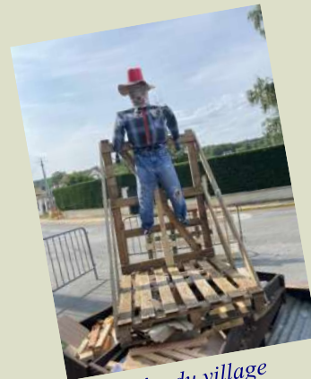
Fête du village