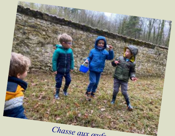
Chasse aux œufs