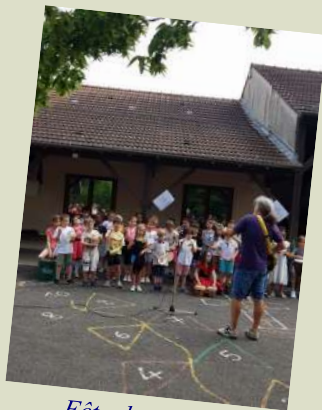
Fête du village