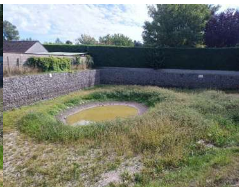
Année 1, les crapauds accoucheur peuvent revenir

Le Parc Naturel Régional du Gâtinais Français a détaillé dans une publication, le détail des travaux réalisés, lors de renaturation de notre mare.