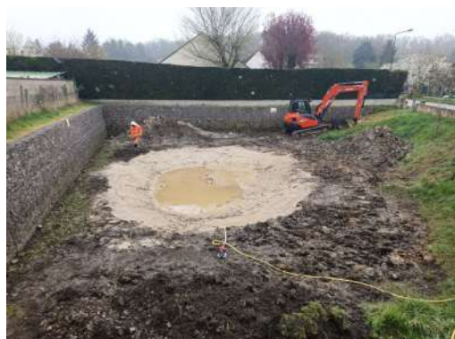
Apport de l'argile