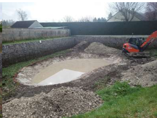
Creusement dans les marnes