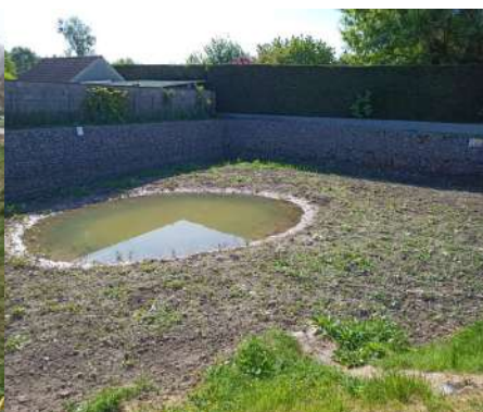
Fin de la réalisation